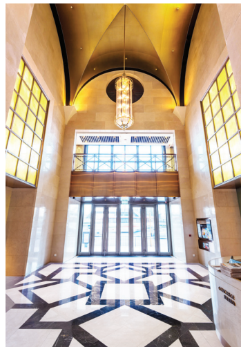
Gloucester Road Elevation 告士打道立面